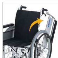
アームサポート はね上げ