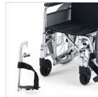
開き式・着脱式 フット・レッグサポート