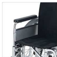
アームサポート 高さ調節