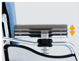
アームサポート高さ調節