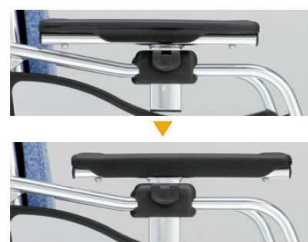
アームサポートパッド左右組み換え