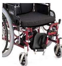
スイングイン機構