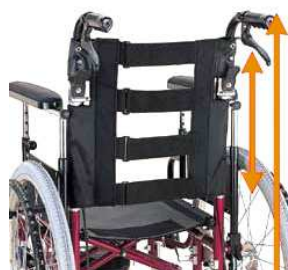
背もたれ高調節、押手高さ調節可能