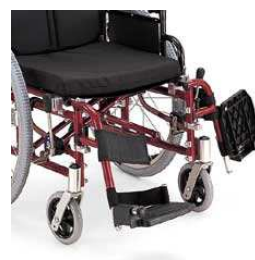
スイングアウト機構