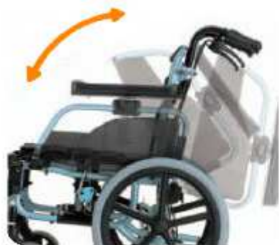
足元スイングアウト