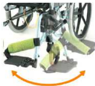
肘掛け跳ね上げ&着脱