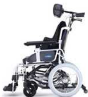
最大前傾ティルト角度-4°