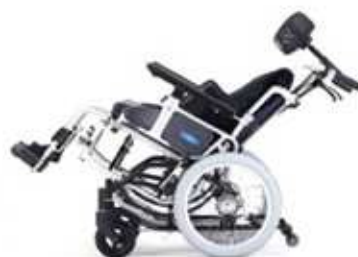
最大後傾ティルト角度30°