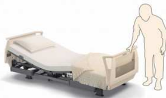
自立動作を支える 伝い歩きボード