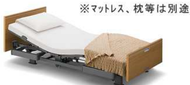
※マットレス、枕等は別途