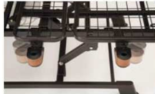
オプション受けの可動域。