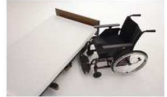
車イスのアプローチを妨げません。

全長：ショート 200cm レギュラー 210cm ロング 224cm 全幅：オプション受け収納時 89cm