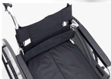
フィッティングベルト