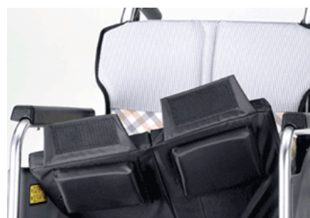
前ズレ防止パット付クッション