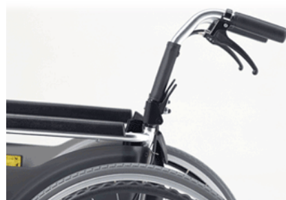
リラックスバックサポート